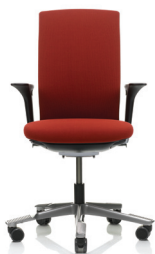
HÅG Futu 1020 m/armleener(opsjon)