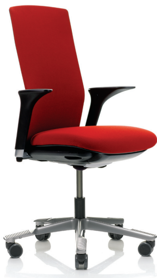
HÅG Futu 1020 m/armleener(opsjon)