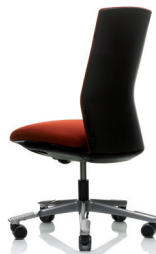
HÅG Futu 1020