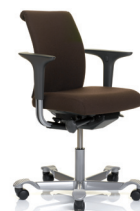
HÅG H05 5300