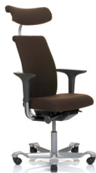
HÅG H05 5500 m/hodehviler (opsjon)