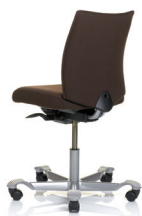
HÅG H05 5200