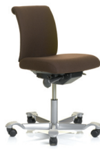
HÅG H05 5100