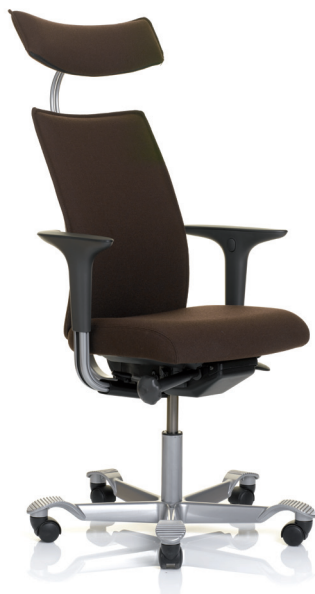
HÅG H05 5600 m/hodehviler(opsjon)