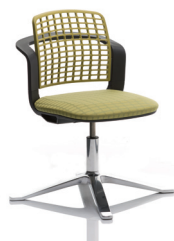
HÅG Sideways 9732