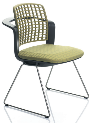
HÅG Sideways 9730